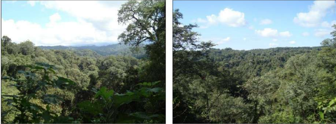
Figura 2. Vista del paisaje típico de la comunidad de Cebil, Palo Blanco y Palo Amarillo Proyecto La Selva de Urundel.