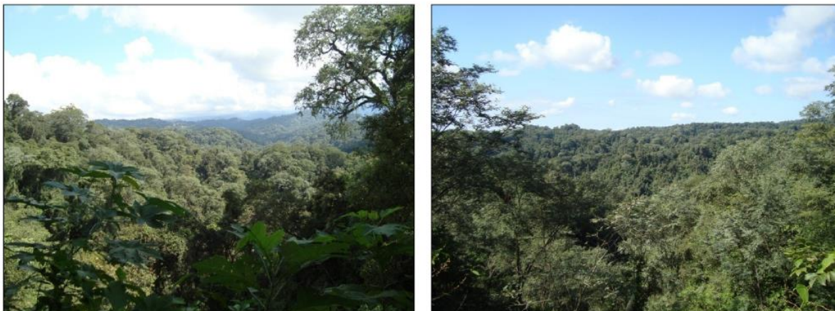
Figura 2. Vista del paisaje típico de la comunidad de Cebil, Palo Blanco y Palo Amarillo Proyecto La Selva de Urundel.